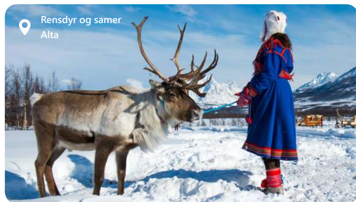
Rensdyr og samer Alta