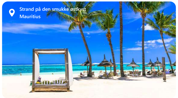
📍 Strand på den smukke østkyst Mauritius

Port Louis er hovedstaden i den idylliske ø-nation Mauritius i Det Indiske Ocean, som er en by, der kombinerer en fascinerende blanding af kulturarv og naturskønhed. Med sin travle havn og imponerende skyline er Port Louis hjertet af øens økonomi og handel. Byen oser af kulturel mangfoldighed med sine farverige markeder, historiske monumenter og kulinariske skatte. Samtidig er Port Louis omgivet af betagende kyststrækninger og frodige bjerglandskaber, hvilket gør den til et perfekt udgangspunkt for at udforske Mauritius' unikke naturskønhed og rige kulturarv.