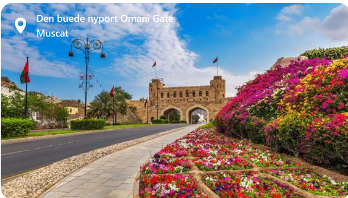
📍 Den buede nyport Omani Gate Muscat

Muscat, hovedstaden i Oman, er præget af sin elegante arkitektur og rigdom af kulturelle skatte. Byens hvide bygninger, flankeret af det imponerende Al Hajar-bjergområde, skaber en spektakulær kontrast. Udforsk det historiske Mutrah-kvarter og besøg det kongelige operahus for en kulturel oplevelse. Det overdådige Al Jalali og Al Mirani-fort vidner om byens historie. Oplev atmosfæren på Mutrah Souq og nyd udsigten over Det Arabiske Hav fra Corniche.