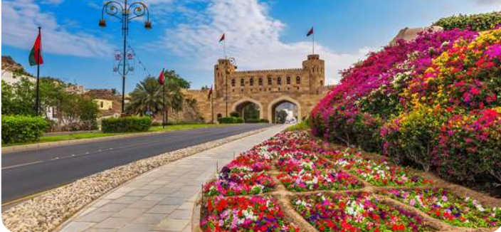
Den buede nyport Omani Gate Muscat

Muscat, hovedstaden i Oman, er præget af sin elegante arkitektur og rigdom af kulturelle skatte. Byens hvide bygninger, flankeret af det imponerende Al Hajar-bjergområde, skaber en spektakulær kontrast. Udforsk det historiske Mutrah-kvarter og besøg det kongelige operahus for en kulturel oplevelse. Det overdådige Al Jalali og Al Mirani-fort vidner om byens historie. Oplev atmosfæren på Mutrah Souq og nyd udsigten over Det Arabiske Hav fra Corniche.