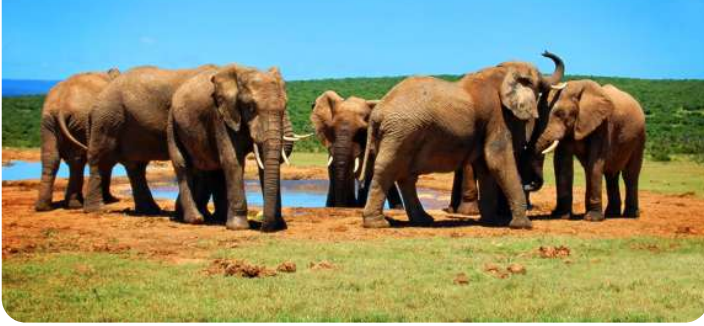
Elefantfamilie ved lille sø Addo Elephant Park

Port Elizabeth, også kendt som "The Friendly City," er en smuk kystby i det sydlige Sydafrika. Algoa Bay imponerer med sine smukke gyldne strande, en malerisk kystlinje og et behageligt klima året rundt. Byen er dynamisk med en rig kulturarv - besøg f.eks. det historiske Donkin Reserve som byder på en flot udsigt fra fyrtårnets top. Eller gå en tur på byen fine Boardwalk ved vandet. Her er shopping og restauranter. Men mest besøgt er Addo Elephant National park som ligger 40 km derfra. En absolut fabelagtig oplevelse. Deres er også Kragga Kama game Park med vilde dyr. For de kunstinteresserede anbefales Route 67.... Port Elizabeth har rigeligt til mange dage....og byder velkommen med sin varme atmosfære og imponerende naturskønhed.