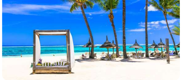
Strand på den smukke østkyst Mauritius

Port Louis er hovedstaden i den idylliske ø-nation Mauritius i Det Indiske Ocean, som er en by, der kombinerer en fascinerende blanding af kulturarv og naturskønhed. Med sin travle havn og imponerende skyline er Port Louis hjertet af øens økonomi og handel. Byen oser af kulturel mangfoldighed med sine farverige markeder, historiske monumenter og kulinariske skatte. Samtidig er Port Louis omgivet af betagende kyststrækninger og frodige bjerglandskaber, hvilket gør den til et perfekt udgangspunkt for at udforske Mauritius' unikke naturskønhed og rige kulturarv.