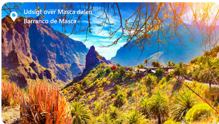
Udsigt over Masca dalen Barranco de Masca