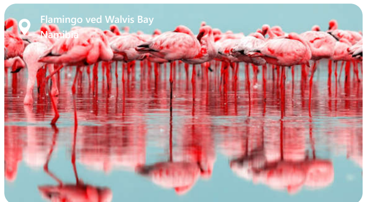
Flamingo ved Walvis Bay Namibia

Walvis Bay er en perle på Namibias atlantehavskyst, som byder besøgende velkommen med sin unikke blanding af ørkenskønhed og maritim charme. Byen er berømt for sin spektakulære naturskønhed, der omfatter ørkenlandskaber, saltpander og det storslåede Pelican Point. Walvis Bay er et paradys for fuglekiggere, da det huser et utal af fuglearter, inklusive de majestætiske flamingoer. Udover sin naturpragt er Walvis Bay også et vigtigt økonomisk knudepunkt, med en travl havn og en blomstrende fiskerisektor. Denne by tilbyder en fascinerende blanding af ørkeneventyr og havliv, der gør den til et unikt rejsemål.