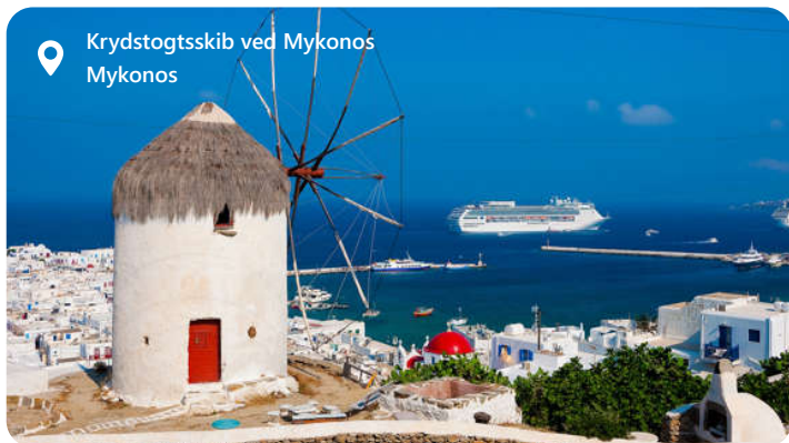
Krydstogtskib ved Mykonos Mykonos