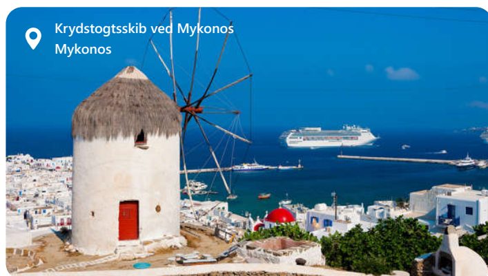
Krydstogtskib ved Mykonos Mykonos

Mykonos, perlen i Det Ægæiske Hav, byder besøgende velkommen med sit maleriske ø-landskab og krystallklare farvande. Denne græske ø er kendt for sine charmerende hvide bygninger med blå kupler, snoede gader og livlige natteliv. Udforsk lokale seværdigheder som det ikoniske Petros of Mykonos og vindmøllerne i Mykonos Town. Nyd autentisk græsk mad med retter som moussaka og souvlaki. Mykonos inviterer dig til at fordype dig i det græske ø-liv og nyde paradiset ved Det Ægæiske Hav.