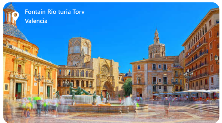
Fontain Rio turia Torv Valencia

Valencia er en smuk region beliggende på den østlige kyst af Spanien, er en skatkiste af historie, kultur og naturskønhed. Med sin fascinerende blanding af middelalderlige monumenter, moderne arkitektur og strålende strande er Valencia en magnet for rejsende fra hele verden. Hjemsted for den berømte paella-ret, byder regionen på en udsøgt kulinarisk oplevelse. Den årlige Las Fallas-festival er et imponerende skue med farverige optog og spektakulære fyrværkeri. Valencia er også kendt for sin arkitektoniske perle, City of Arts and Sciences. Dette sted er et paradys for kunst- og videnskabsentusiaster. Valencia er kort sagt en destination, der fusionerer fortidens pragt med nutidens dynamik og naturens skønhed.