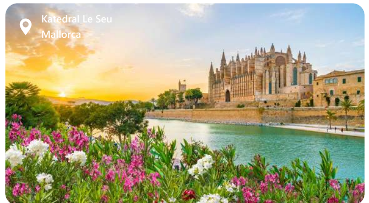
Katedral Le Seu Mallorca

Palma de Mallorca er hovedstaden på den spanske ø Mallorca i Middelhavet, der er en strålende blanding af historie og moderne skønhed. Denne charmerende by, omgivet af azurblåt hav og bjerglandskaber, byder besøgende velkommen med sin pragtfulde gotiske katedral, Almudaina-paladset og smalle brostensbelagte gader i den gamle bydel. Palma er også kendt for sine billedskønne strande, luksuriøse havneområder og et pulserende natteliv. Her kan du nyde Middelhavets lækkerier på de lokale restauranter og opleve den autentiske spanske kultur og gæstfrihed i en spektakulær ø-kulisse.