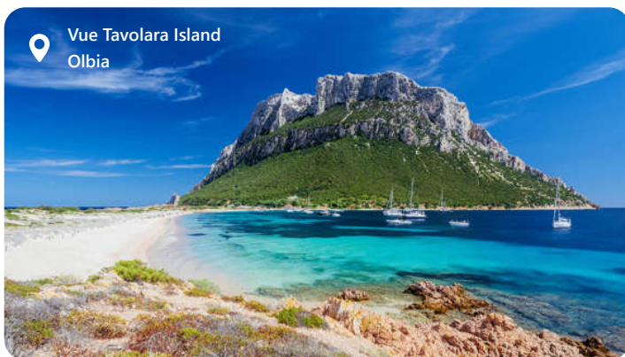
Vue Tavolara Island Olbia