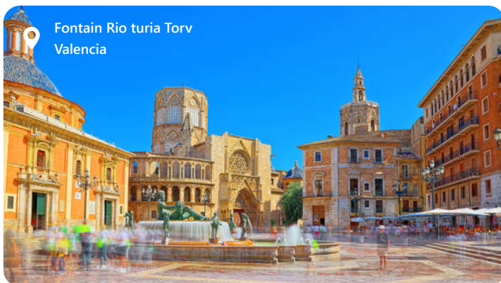
Fontain Rio turia Torv Valencia

også en rig maritim arv og huser Frankrigs største flådehavn. Besøgende kan udforske byens gamle bydel, opdage historiske seværdigheder som Toulon-katedralen, og nyde den lokale Provençalske køkken. Byen stråler med kultur og et livligt byliv og er en uforglemmelig destination ved Middelhavet.