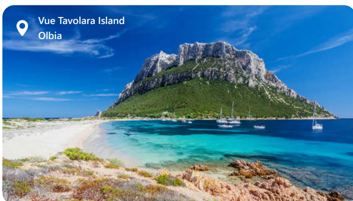
Vue Tavolara Island Olbia