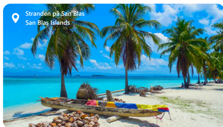
Stranden på San Blas San Blas Islands