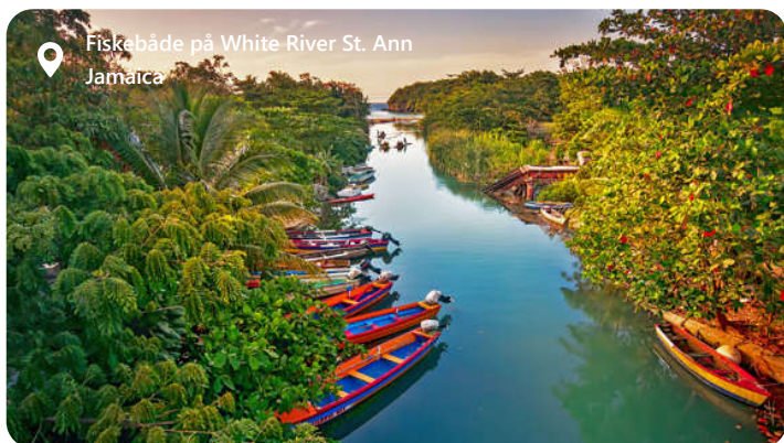
Fiskebåde på White River St. Ann Jamaica