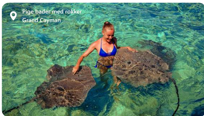
Pige bader med rokker Grand Cayman

Cayman Islands er også kendt for deres smukke strande og klare caribiske hav, som byder på unikke dykkeroplevelser, skildpadde-reservater, snorkle med rokker og skattefri shopping. Med sin blanding af kultur, luksuriøse resorts og naturlig skønhed forbliver Georgetown og Cayman Islands en attraktiv destination for dem, der søger en afslappende tropisk ferieoplevelse.