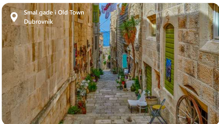
Smal gade i Old Town Dubrovnik