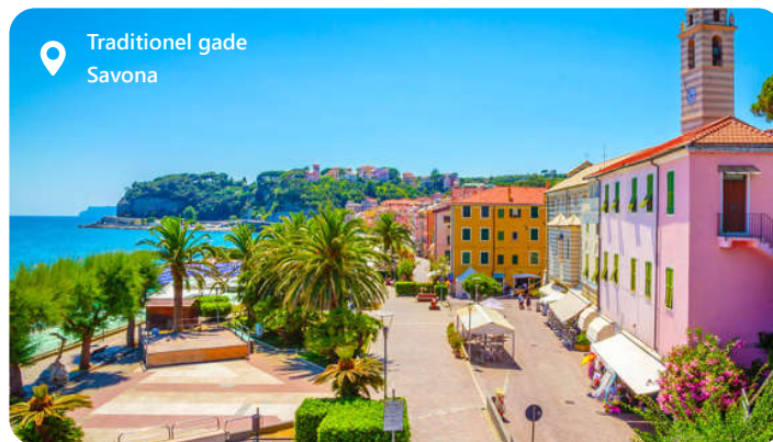
Traditionel gade Savona

Savona byder dig velkommen med sin skønhed og historiske charme. Byen er Costa Cruises base, og derfor kommer mange af deres skibe også i land her. Savona er en destination, der byder på solrige strande og en gammel bydel der er fyldt med smalle gader og fascinerende arkitektoniske perler. Nyd de lækre italienske retter på lokale restauranter, og oplev den varme og gæstfri atmosfære i denne fantastiske by. Ikke langt fra Savona er der et rigt udbud af oplevelser. For de eventyrlystne er der inde i baglandet Via Ferrata degli Artisti. Hele kyststrækningen kaldes Ligurien og byder på fortryllende små åndehuller. Men mest af alt er det vær at opleve de 5 små kystbyer ved Cinque Terre.