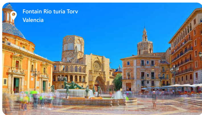
Fontain Rio turia Torv Valencia