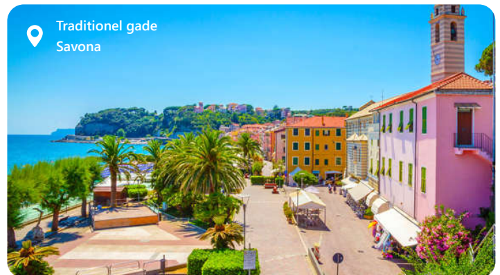
Traditionel gade Savona

Savona byder dig velkommen med sin skønhed og historiske charme. Byen er Costa Cruises base, og derfor kommer mange af deres skibe også i land her. Savona er en destination, der byder på solrige strande og en gammel bydel der er fyldt med smalle gader og fascinerende arkitektoniske perler. Nyd de lækre italienske retter på lokale restauranter, og oplev den varme og gæstfri atmosfære i denne fantastiske by. Ikke langt fra Savona er der et rigt udbud af oplevelser. For de eventyrlystne er der inde i baglandet Via Ferrata degli Artist. Hele kyststrækningen kaldes Ligurien og byder på fortryllende små åndehuller. Men mest af alt er det vær at opleve de 5 små kystbyer ved Cinque Terre.