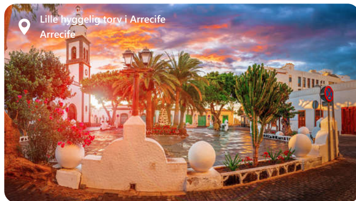
Lille hyggelig torv i Arrecife Arrecife

Lanzarote, en af De Kanariske Øer i Spanien, indfanger besøgende med sin unikke vulkanske skønhed og ro. Øen er kendt for sine månelignende landskaber, herunder Timanfaya National Park og de underspillede hvide huse. Udforsk de lokale kulturelle seværdigheder som Cueva de los Verdes og César Manrique Foundation, og nyd autentiske kanariske kulinariske oplevelser. Lanzarote tilbyder en harmonisk blanding af natur og kunst, hvilket gør den til en ideel destination for dem, der ønsker at udforske det kanariske ø-paradis og finde ro i dens enestående landskaber.