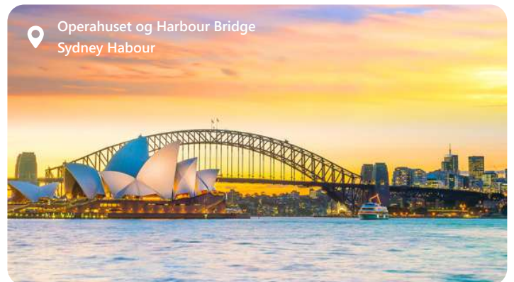
Operahuset og Harbour Bridge Sydney Harbour

Sydney, Australiens smukke hjerte, er en by, der fejrer livet ved vandet. Med sin ikoniske havn og de imponerende Sydney Harbour Bridge og Operahuset, vil du blive fortryllet af byens panoramaudsigt. Sydney byder på pragtfulde strande som Bondi Beach, hvor du kan nyde solen og bølgerne. Denne multikulturelle by er kendt for sin livlige cafékultur og en imponerende madscene. Tag en spadseretur i Royal Botanic Garden eller udforsk de fascinerende historiske kvarterer. Sydney inviterer dig til at udforske sin unikke blanding af natur, kultur og eventyr i smukke omgivelser.