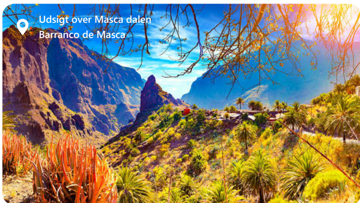
Udsigt over Masca dalen Barranco de Masca