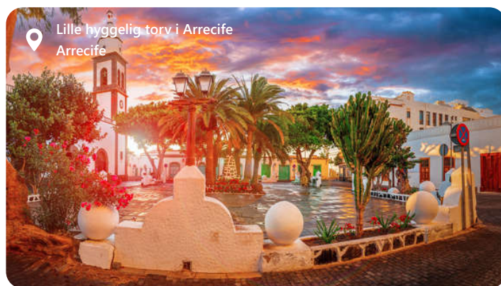
Lille hyggelig torv i Arrecife Arrecife

Lanzarote, en af De Kanariske Øer i Spanien, indfanger besøgende med sin unikke vulkanske skønhed og ro. Øen er kendt for sine månelignende landskaber, herunder Timanfaya National Park og de underspillede hvide huse. Udforsk de lokale kulturelle seværdigheder som Cueva de los Verdes og César Manrique Foundation, og nyd autentiske kanariske kulinariske oplevelser. Lanzarote tilbyder en harmonisk blanding af natur og kunst, hvilket gør den til en ideel destination for dem, der ønsker at udforske det kanariske ø-paradis og finde ro i dens enestående landskaber.