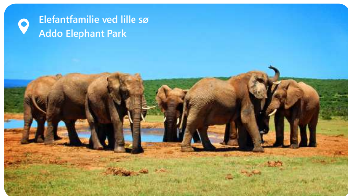
Elefantfamilie ved lille sø Addo Elephant Park

Port Elizabeth, også kendt som "The Friendly City," er en smuk kystby i det sydlige Sydafrika. Algoa Bay imponerer med sine smukke gyldne strande, en malerisk kystlinje og et behageligt klima året rundt. Byen er dynamisk med en rig kulturarv - besøg f.eks. det historiske Donkin Reserve som byder på en flot udsigt fra fyrtårnets top. Eller gå en tur på byens fine Boardwalk ved vandet. Her er shopping og restauranter. Men mest besøgt er Addo Elephant National park som ligger 40 km derfra. En absolut fabelagtig oplevelse. Deres er også Kragga Kama game Park med vilde dyr. For de kunstinteresserede anbefales Route 67.... Port Elizabeth har rigeligt til mange dage....og byder velkommen med sin varme atmosfære og imponerende naturskønhed.