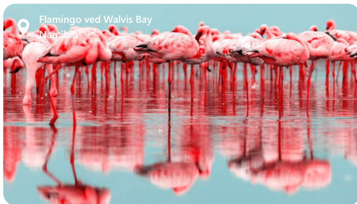
Flamingo ved Walvis Bay Namibia

Walvis Bay er en perle på Namibias atlantehavskyst, som byder besøgende velkommen med sin unikke blanding af ørkenkønhed og maritim charme. Byen er berømt for sin spektakulære naturskønhed, der omfatter ørkenlandskaber, saltpander og det storslåede Pelican Point. Walvis Bay er et paradys for fuglekiggere, da det huser et utal af fuglearter, inklusive de majestætiske flamingoer. Udover sin naturpragt er Walvis Bay også et vigtigt økonomisk knudepunkt, med en travl havn og en blomstrende fiskerisektor. Denne by tilbyder en fascinerende blanding af ørkeneventyr og havliv, der gør den til et unikt rejsemål.