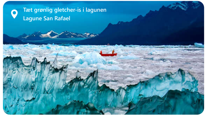
Tæt grønlig gletcher-is i lagunen Lagune San Rafael

Puerto Chacabuco er beliggende i den maleriske Aysén-region i det sydlige Chile, og er gateway til områdets smukke nationalparker med fjorde, gletsjere og sneklædte bjerge. Med andre ord, Porten til den chilenske del af naturområdet Patagonien. Dette afsides område er omgivet af storslåede fjorde, gletsjere og majestætiske bjerglandskaber. Oplev den uberørte naturs store mesterværker, som tryllebinder på en magisk måde. Se f.eks. is-laguna San Rafael eller den smukke park "Parque Aiken del Sur". Deltag i udendørsaktiviteter som vandreture og kajakroning og nyd samtidig godt af den unikke chilenske kultur. Dette idylliske sted er en oplevelse for naturskere og dem, der søger eventyr i den uberørte del af verden.