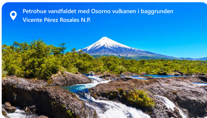
Petrohue vandfaldet med Osorno vulkanen i baggrunden Vicente Pérez Rosales N.P.