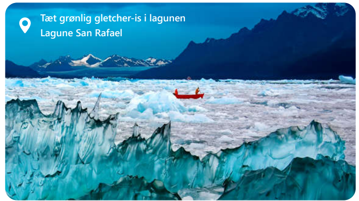
Tæt grønlig gletcher-is i lagunen Lagune San Rafael

Puerto Chacabuco er beliggende i den maleriske Aysén-region i det sydlige Chile, og er gateway til områdets smukke nationalparker med fjorde, gletsjere og sneklædte bjerge. Med andre ord, Porten til den chilenske del af naturområdet Patagonien. Dette afsides område er omgivet af storslåede fjorde, gletsjere og majestætiske bjerglandskaber. Oplev den uberørte naturs store mesterværker, som tryllebinder på en magisk måde. Se f.eks. is-laguna San Rafael eller den smukke park "Parque Aiken del Sur". Deltag i udendørsaktiviteter som vandreture og kajakroning og nyd samtidig godt af den unikke chilenske kultur. Dette idylliske sted er en oplevelse for naturskere og dem, der søger eventyr i den uberørte del af verden.