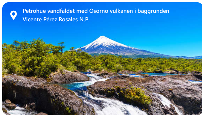
Petrohue vandfaldet med Osorno vulkanen i baggrunden Vicente Pérez Rosales N.P.