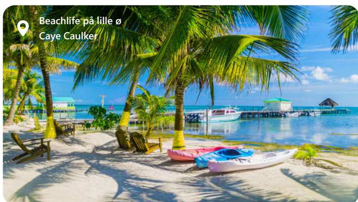
Beachlife på lille ø Caye Caulker