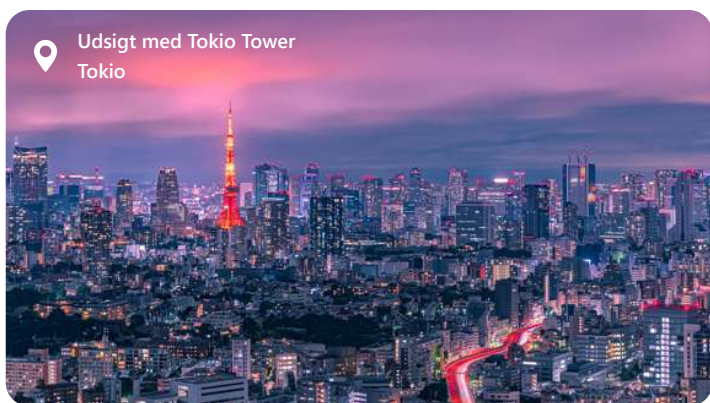
Udsigt med Tokio Tower Tokio

kulinariske oplevelser. Keelung tilbyder en harmonisk blanding af havliv og kultur, hvilket gør den til en ideel destination for dem, der ønsker at udforske Taiwans skønhed og smage på dens kulinariske oplevelser.