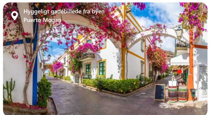
Hyggeligt gadebillede fra byen Puerto Mogan

Las Palmas, hovedstaden på Gran Canaria i Spanien, byder besøgende velkommen med sin solrige atmosfære og kulturelle mangfoldighed. Byen er kendt for sine smukke strande, inklusive Playa de Las Canteras, og en række kulturelle begivenheder og festivaler. Udforsk de lokale kulturelle perler som Casa de Colón og Catedral de Santa Ana, og nyd autentiske kanariske kulinariske oplevelser med lokale retter og vine. Las Palmas tilbyder en harmonisk blanding af sol og kultur, hvilket gør den til en ideel destination for dem, der ønsker at udforske Gran Canarias naturskønhed og rige kulturarv.