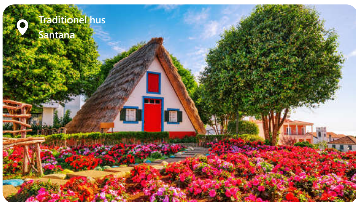
Traditionel hus Santana