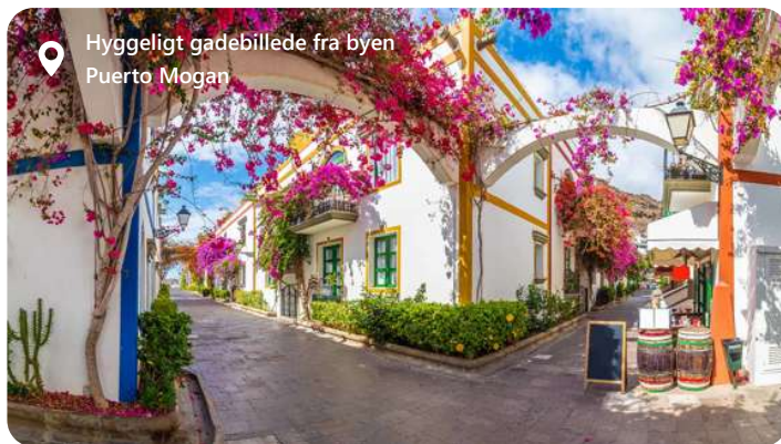
Hyggeligt gadebillede fra byen Puerto Mogan

Las Palmas, hovedstaden på Gran Canaria i Spanien, byder besøgende velkommen med sin solrige atmosfære og kulturelle mangfoldighed. Byen er kendt for sine smukke strande, inklusive Playa de Las Canteras, og en række kulturelle begivenheder og festivaler. Udforsk de lokale kulturelle perler som Casa de Colón og Catedral de Santa Ana, og nyd autentiske kanariske kulinariske oplevelser med lokale retter og vine. Las Palmas tilbyder en harmonisk blanding af sol og kultur, hvilket gør den til en ideel destination for dem, der ønsker at udforske Gran Canarias naturskønhed og rige kulturarv.