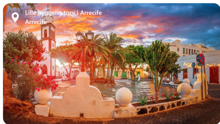
Lille hyggelig torv i Arrecife Arrecife