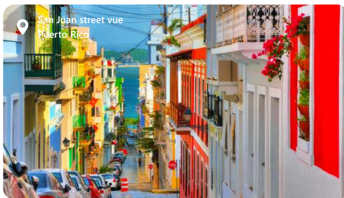
San Juan street vue Puerto Rico

San Juan, hovedstaden på Puerto Rico, byder på en enestående kombination af historie og skønhed. De farverige bygninger i det gamle San Juan, en UNESCO-verdensarvssted, skaber en malerisk kulisse for din rejse. Udforsk de velbevarede fæstninger som El Morro og San Cristóbal, der har beskyttet byen i århundreder. De smukke strande, som Condado og Isla Verde, er ideelle til afslapning og vandsport. San Juans gader summer af liv med livlige markeder og autentiske restauranter, der serverer skøn puertoricansk mad. Denne by vil fortrylle dig med sin caribiske atmosfære og historiske rigdom.