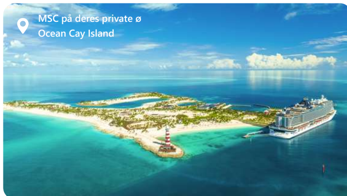
MSC på deres private ø Ocean Cay Island

Øens fulde navn er Ocean Cay MSC Marine Reserve, og den ligger i det smukke øhav i Bahamas. Den er MSC's egen private ø og en tropisk oase. Øen var tidligere et industriområde, men har undergået en bemærkelsesværdig transformation til et bæredygtigt feriested med uberørt smuk natur og hvide sandstrande omgivet af det smukke caribiske hav. Med fokus på bæredygtighed er Ocean Cay et unikt sted, hvor du kan nyde en stranddag i de bedste omgivelser - tæt på naturen, den rolige atmosfære og det tropiske paradys.