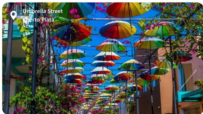
Umbrella Street Puerto Plata