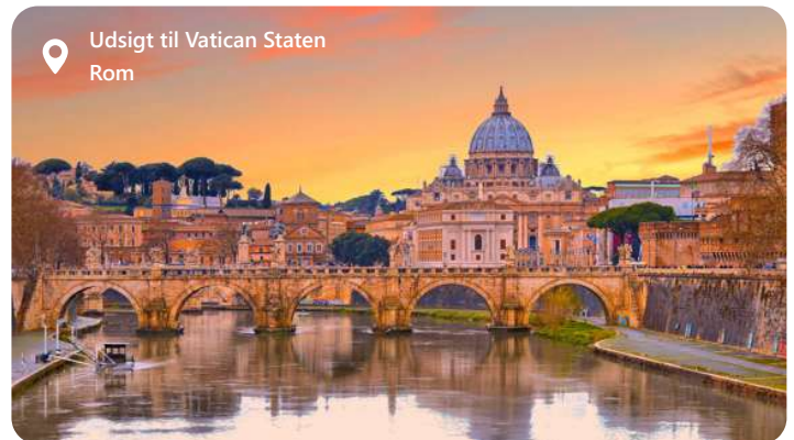
Udsigt til Vatikan Staten Rom