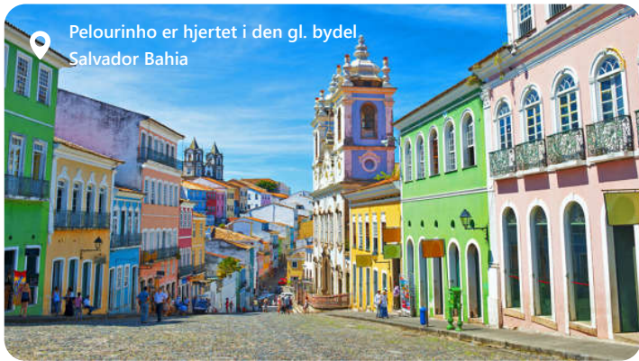
Pelourinho er hjertet i den gl. bydel. Salvador Bahia