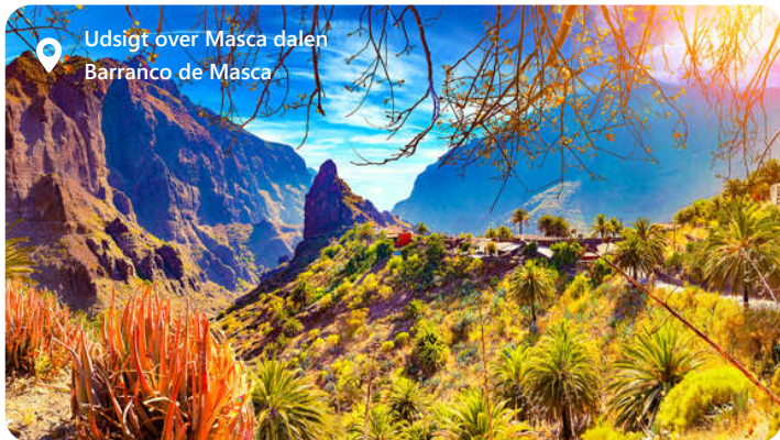
Udsigt over Masca dalen Barranco de Masca