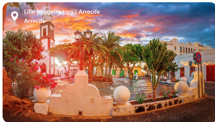
Lille hyggelig torv i Arrecife Arrecife

Lanzarote, en af De Kanariske Øer i Spanien, indfanger besøgende med sin unikke vulkanske skønhed og ro. Øen er kendt for sine månelignende landskaber, herunder Timanfaya National Park og de underspillede hvide huse. Udforsk de lokale kulturelle seværdigheder som Cueva de los Verdes og César Manrique Foundation, og nyd autentiske kanariske kulinariske oplevelser. Lanzarote tilbyder en harmonisk blanding af natur og kunst, hvilket gør den til en ideel destination for dem, der ønsker at udforske det kanariske ø-paradis og finde ro i dens enestående landskaber.