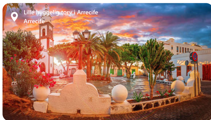
Lille hyggelig torv i Arrecife Arrecife

Lanzarote, en af De Kanariske Øer i Spanien, indfanger besøgende med sin unikke vulkanske skønhed og ro. Øen er kendt for sine månelignende landskaber, herunder Timanfaya National Park og de underspillede hvide huse. Udforsk de lokale kulturelle seværdigheder som Cueva de los Verdes og César Manrique Foundation, og nyd autentiske kanariske kulinariske oplevelser. Lanzarote tilbyder en harmonisk blanding af natur og kunst, hvilket gør den til en ideel destination for dem, der ønsker at udforske det kanariske ø-paradis og finde ro i dens enestående landskaber.