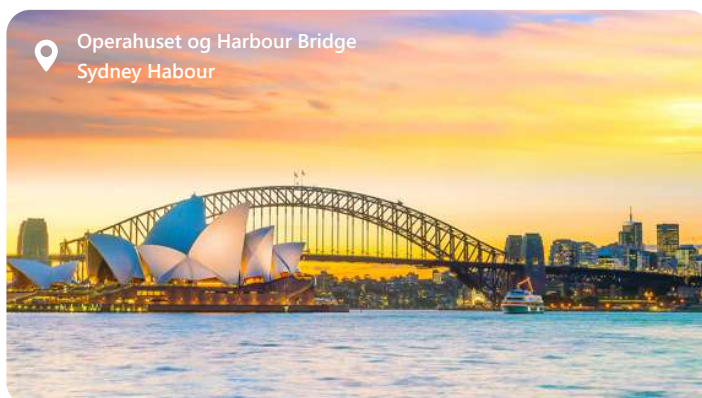
Operahuset og Harbour Bridge Sydney Harbour

Sydney, Australiens smukke hjerte, er en by, der fejrer livet ved vandet. Med sin ikoniske havn og de imponerende Sydney Harbour Bridge og Operahuset, vil du blive fortryllet af byens panoramaudsigt. Sydney byder på pragtfulde strande som Bondi Beach, hvor du kan nyde solen og bølgerne. Denne multikulturelle by er kendt for sin livlige cafékultur og en imponerende madscene. Tag en spadseretur i Royal Botanic Garden eller udforsk de fascinerende historiske kvarterer. Sydney inviterer dig til at udforske sin unikke blanding af natur, kultur og eventyr i smukke omgivelser.