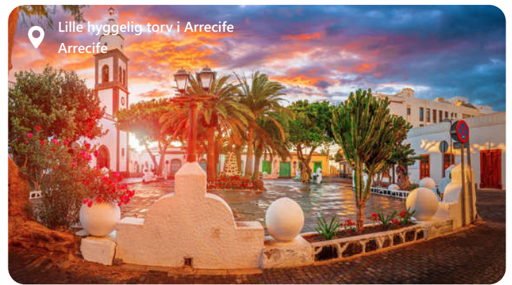
Lille hyggelig torv i Arrecife Arrecife

Lanzarote, en af De Kanariske Øer i Spanien, indfanger besøgende med sin unikke vulkanske skønhed og ro. Øen er kendt for sine månelignende landskaber, herunder Timanfaya National Park og de underspillede hvide huse. Udforsk de lokale kulturelle seværdigheder som Cueva de los Verdes og César Manrique Foundation, og nyd autentiske kanariske kulinariske oplevelser. Lanzarote tilbyder en harmonisk blanding af natur og kunst, hvilket gør den til en ideel destination for dem, der ønsker at udforske det kanariske ø-paradis og finde ro i dens enestående landskaber.