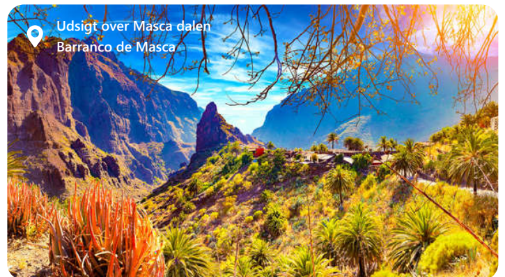
Udsigt over Masca dalen Barranco de Masca

Tenerife er den største af De Kanariske Øer og en skat i Atlanterhavet, som byder besøgende velkommen med en betagende skønhed og en mangfoldig kultur. Øen er kendt for sin dramatiske vulkanske landskab, herunder den majestætiske Teide-vulkan, Spaniens højeste bjerg. Tenerife tilbyder solbeskinnede strande, livlige feriesteder og charmerende, historiske byer som La Laguna. Hovedstaden Santa Cruz, og det frodige Orotava-dal tilføjer til øens appel. Med sin blanding af natur, kultur og afslapning er Tenerife en destination, der appellerer til enhver rejsendes smag.