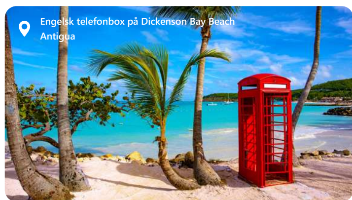
Engelsk telefonbox på Dickenson Bay Beach Antigua