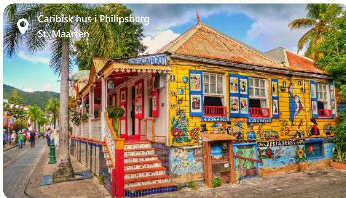
Caribisk hus i Philipsburg St. Maarten

St. Maarten er delt mellem Holland og Frankrig og er derfor en unik blanding af europæisk charme og caribisk skønhed. Philipsburg er hovedstaden i den hollandske del og er en levende og farverig by med en rig historie, pulserende kultur og en spektakulær kystlinje, der tiltrækker både krydstogtgæster og øvrige turister. Kombinationen af historisk charme, moderne bekvemmeligheder og naturlig skønhed gør Philipsburg til en uforglemmelig destination - uanset om du er interesseret i at udforske kulturelle seværdigheder, shoppe, fornøje dig med vandsport eller bare slappe af på stranden.