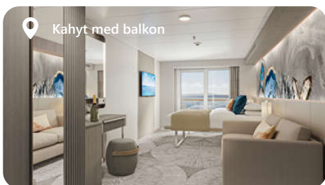
Kahyt med balkon

O4 - Familie udvendig OA - Stor Udvendig Med Rundt Vindue OB - Havudsigt Med Rundt Vindue OX - Sejl Væk Havudsigt Oceanview Solo Oceanview