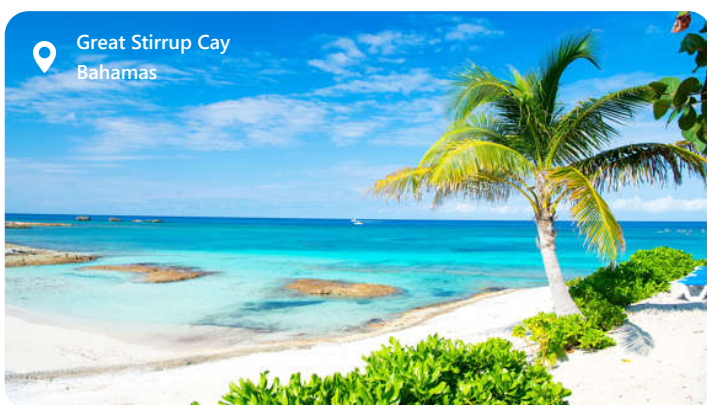
Great Stirrup Cay Bahamas

byder området også på smukke strande, fiskemuligheder og rekreative aktiviteter. Besøgende kan udforske en spændende blanding af rumfarts- og maritime kulturer og nyde solen, sandet og havnelivet i Port Canaveral.