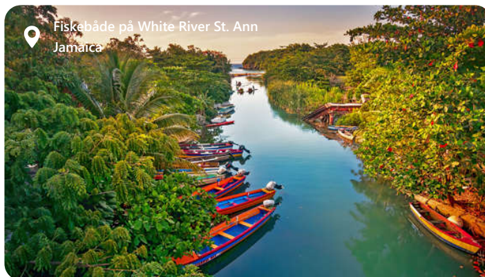
Fiskebåde på White River St. Ann Jamaica

Falmouth er en tropisk juvel ved det karibiske hav, der byder besøgende velkommen med sin varme sol, smukke strande og rig kulturarv. Denne historiske by, beliggende på øens nordkyst, er kendt for sin velbevarede georgianske arkitektur og farverige gader. Falmouths pulserende kulturliv, herunder musik, dans og lækker mad, afspejler øens rige arv og gæstfrihed. Udforskende rejsende vil finde eventyrlige muligheder som dykning i det krystalklare vand, besøg i sukkerplantager og interaktion med den venlige lokale befolkning. Falmouth er en skatkiste af oplevelser og skønhed, der venter på at blive opdaget.