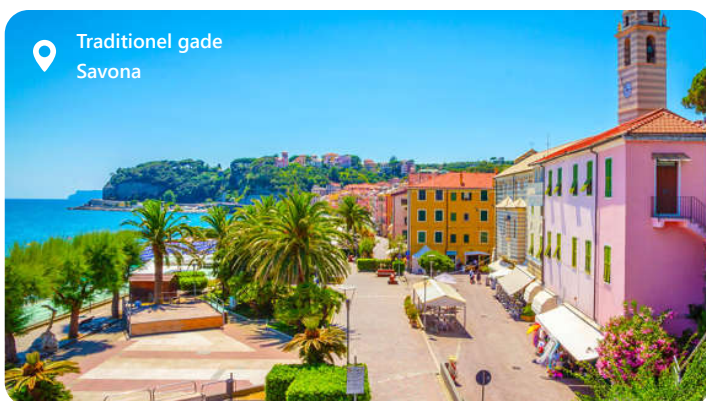
Traditionel gade Savona

with cosmopolitan cuisine. You cannot leave without having first toured on the "Cours Julien", the street for shopping. The port of Marseille is perhaps a typical tourist destination, but it deserves to be visited for the ferry that leaves from the Town Hall and the old church, which replaced a Templar building.