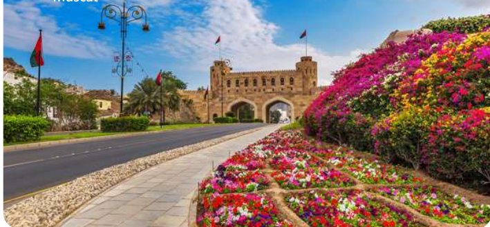
Den buede nyport Omani Gate Muscat

Muscat, hovedstaden i Oman, er præget af sin elegante arkitektur og rigdom af kulturelle skatte. Byens hvide bygninger, flankeret af det imponerende Al Hajar-bjergområde, skaber en spektakulær kontrast. Udforsk det historiske Mutrah-kvarter og besøg det kongelige operahus for en kulturel oplevelse. Det overdådige Al Jalali og Al Mirani-fort vidner om byens historie. Oplev atmosfæren på Mutrah Souq og nyd udsigten over Det Arabiske Hav fra Corniche.