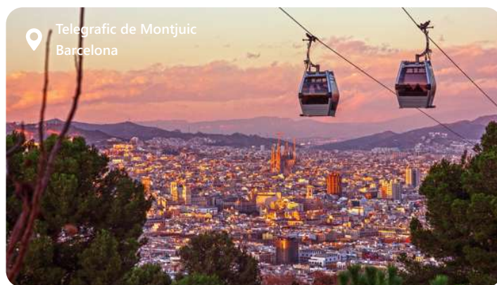
Telegrafic de Montjuic Barcelona

Barcelona - en charmerende metropol og hovedstad i det katalanske Nordspanien. Byen er en sand perle hvor historie og nutid forenes i perfekt harmoni. Særligt Gaudís fascinerende mesterværker som La Sagrada Família og Park Güell, tager enhver med storm. Byen stråler af kulturel rigdom med kunstgallerier, museer og et livligt gademiljø. De gyldne sandstrande langs kysten og den fortryllende gotiske kvarter skaber en atmosfære, der indfanger hjertet og sindet. Barcelona er ikke blot en by, det er en oplevelse.