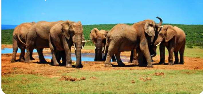
Elefantfamilie ved lille sø Addo Elephant Park

Port Elizabeth, også kendt som "The Friendly City," er en smuk kystby i det sydlige Sydafrika. Algoa Bay imponerer med sine smukke gyldne strande, en malerisk kystlinje og et behageligt klima året rundt. Byen er dynamisk med en rig kulturarv - besøg f.eks. det historiske Donkin Reserve som byder på en flot udsigt fra fyrtårnets top. Eller gå en tur på byen fine Boardwalk ved vandet. Her er shopping og restauranter. Men mest besøgt er Addo Elephant National park som ligger 40 km derfra. En absolut fabelagtig oplevelse. Deres er også Kragga Kama game Park med vilde dyr. For de kunstinteresserede anbefales Route 67.... Port Elizabeth har rigeligt til mange dage....og byder velkommen med sin varme atmosfære og imponerende naturskønhed.