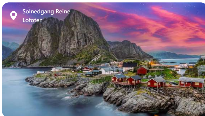
Solnedgang Reine Lofoten

Leknes er porten til naturvidunderet Lofoten. En idyllisk by på Vestvågøy-øen i Norge, som er omgivet af bjerge og klare fjorde. Besøgende kan nyde den maleriske charme, udforske det enestående landskab og opleve den autentiske nordnorske kultur. Leknes byder på fantastiske udendørsaktiviteter som vandreture og fiskeri, samt kulturelle oplevelser med museer og lokale markeder. Det er en destination, der forener naturens skønhed med den nordiske gæstfrihed.