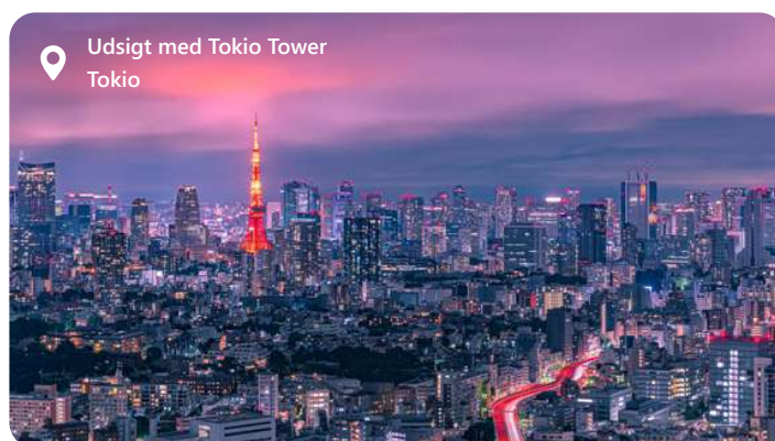
Udsigt med Tokio Tower Tokio

Tokyo er Japans hovedstad, som er en dynamisk metropol, der smelter tradition og teknologi sammen på forbløffende vis. Med sine skinnende skyskrabere, travle gader og en broget blanding af kvarterer, tilbyder Tokyo en uendelig strøm af oplevelser. Byen er kendt for sin dybe kulturarv, der afspejles i templer som Senso-ji og det kejserlige palads, samtidig med at den er en global trendsetter inden for mode og teknologi. Maden i Tokyo er en sand lækkerbidsken med alt fra street food til Michelin-stjerne restauranter. Tokyo er en by, der konstant fornyer sig selv, og den byder besøgende velkommen med sin unikke blanding af tradition og innovation.