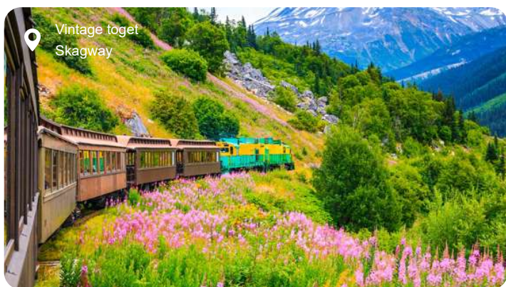
Vintage toget Skagway

their knowledge of this amazing place and host a fun Junior Ranger program for kids. They may even be able to help you identify Glacier Bay's abundant wildlife, including humpback whales, sea otters, porpoises, harbor seals, black bears, mountain goats, bald eagles and large colonies of seabirds. Take in the awe-inspiring scenery as you enjoy an unforgettable day of sailing through this dazzling park, where you'll glide along emerald waters and past calving icebergs, and can breathe in the crisp, fresh air to your heart's content.