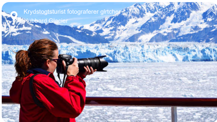
Krydstogtsturist fotograferer gltcher Hubbard Glacier