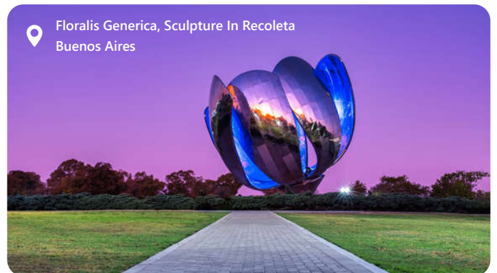
Floralis Generica, Sculpture In Recoleta Buenos Aires

Buenos Aires, Argentinas hovedstad, er en by fyldt med energi og passion. Den er kendt for sin unikke stil og charme. Som kulturelt centrum i Sydamerika er byen kendt for sin blomstrende kunstscene og er hjemsted for mange verdenskendte kunstnere samt en rig historie, der afspejles i dens arkitektur. Se bl.a. Plaza de Mayo, Casa Rosada (regeringspaladset), og La Recoleta, Gå ikke glip af byens tango-shows og dansehaller, hvor besøgende kan opleve den ikoniske dansearter. Der er fantastisk shopping især på Avenida Florida, hvor du finder alt fra designerbutikker til lokale markeder. Rundt om byen findes smukke naturområder som Reserva Ecológica Costanera Sur og Jardín Botánico Carlos Thays.