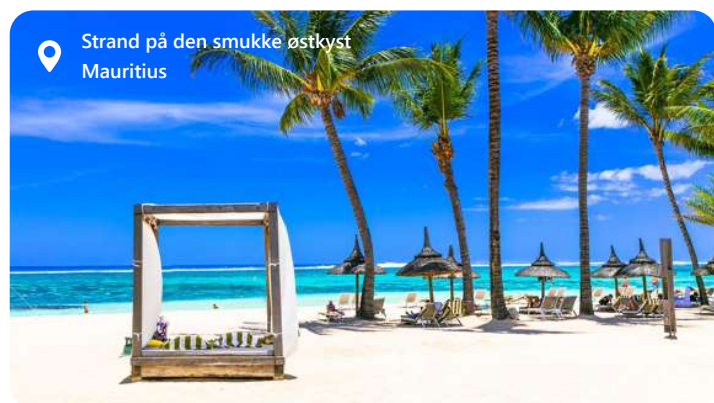
Strand på den smukke østkyst Mauritius