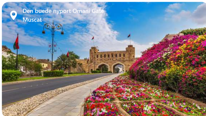
Den buede nyport Omani Gate Muscat

Muscat, hovedstaden i Oman, er præget af sin elegante arkitektur og rigdom af kulturelle skatte. Byens hvide bygninger, flankeret af det imponerende Al Hajar-bjergområde, skaber en spektakulær kontrast. Udforsk det historiske Mutrah-kvarter og besøg det kongelige operahus for en kulturel oplevelse. Det overdådige Al Jalali og Al Mirani-fort vidner om byens historie. Oplev atmosfæren på Mutrah Souq og nyd udsigten over Det Arabiske Hav fra Corniche.