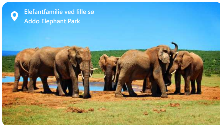
Elefantfamilie ved lille sø Addo Elephant Park

Port Elizabeth, også kendt som "The Friendly City," er en smuk kystby i det sydlige Sydafrika. Algoa Bay imponerer med sine smukke gyldne strande, en malerisk kystlinje og et behageligt klima året rundt. Byen er dynamisk med en rig kulturarv - besøg f.eks. det historiske Donkin Reserve som byder på en flot udsigt fra fyrtårnets top. Eller går en tur på byen fine Boardwalk ved vandet. Her er shopping og restauranter. Men mest besøgt er Addo Elephant National park som ligger 40 km derfra. En absolut fabelagtig oplevelse. Deres er også Kragga Kama game Park med vilde dyr. For de kunstinteresserede anbefales Route 67.... Port Elizabeth har rigeligt til mange dage....og byder velkommen med sin varme atmosfære og imponerende naturskønhed.