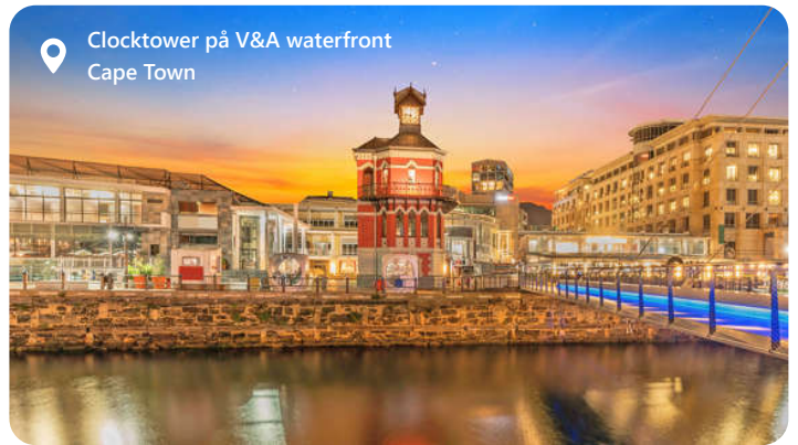
📍 Clocktower på V&A waterfront Cape Town

Cape Town er godt begunstiget fra naturens siden med en af de smukkeste beliggenheder i verden. Omgivet af Table Mountain, Lion's Head og Twelve Apostles Mountains. Den fantastiske placering ved kysten gør det til et populært sted for vandsport som surfing, sejlads og ikke mindst feriestunder på strandene Camps Bay og Clifton Beach lige syd for byen. Samtidig besidder byen på en rig historie, der spænder over flere århundreder og omfatter indflydelse fra europæiske kolonister, malaysiske samfund og oprindelige kulturer. Der er mange museer og historiske steder at udforske, herunder District Six Museum. Et godt sted at starte for de som gerne vil lære mere om tiden fra apartheid. Her kan ture til townships og fængselsøen Robben Island anbefales.