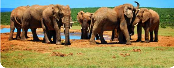
📍 Elefantfamilie ved lille sø Addo Elephant Park

Port Elizabeth, også kendt som "The Friendly City," er en smuk kystby i det sydlige Sydafrika. Algoa Bay imponerer med sine smukke gyldne strande, en malerisk kystlinje og et behageligt klima året rundt. Byen er dynamisk med en rig kulturarv - besøg f.eks. det historiske Donkin Reserve som byder på en flot udsigt fra fyrtårnets top. Eller gå en tur på byen fine Boardwalk ved vandet. Her er shopping og restauranter. Men mest besøgt er Addo Elephant National park som ligger 40 km derfra. En absolut fabelagtig oplevelse. Deres er også Kragga Kama game Park med vilde dyr. For de kunstinteresserede anbefales Route 67.... Port Elizabeth har rigeligt til mange dage....og byder velkommen med sin varme atmosfære og imponerende naturskønhed.