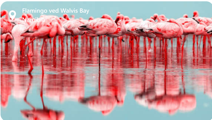
📍 Flamingo ved Walvis Bay Namibia

Walvis Bay er en perle på Namibias atlantehavskyst, som byder besøgende velkommen med sin unikke blanding af ørkenskønhed og maritim charme. Byen er berømt for sin spektakulære naturskønhed, der omfatter ørkenlandskaber, saltpander og det storslåede Pelican Point. Walvis Bay er et paradys for fuglekiggere, da det huser et utal af fuglearter, inklusive de majestætiske flamingoer. Udover sin naturpragt er Walvis Bay også et vigtigt økonomisk knudepunkt, med en travl havn og en blomstrende fiskerisektor. Denne by tilbyder en fascinerende blanding af ørkeneventyr og havliv, der gør den til et unikt rejsemål.