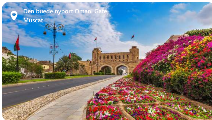
Den buede nyport Omani Gate Muscat

Muscat, hovedstaden i Oman, er præget af sin elegante arkitektur og rigdom af kulturelle skatte. Byens hvide bygninger, flankeret af det imponerende Al Hajar-bjergområde, skaber en spektakulær kontrast. Udforsk det historiske Mutrah-kvarter og besøg det kongelige operahus for en kulturel oplevelse. Det overdådige Al Jalali og Al Mirani-fort vidner om byens historie. Oplev atmosfæren på Mutrah Souq og nyd udsigten over Det Arabiske Hav fra Corniche.