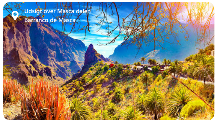
Udsigt over Masca dalen Barranco de Masca

Tenerife er den største af De Kanariske Øer og en skat i Atlanterhavet, som byder besøgende velkommen med en betagende skønhed og en mangfoldig kultur. Øen er kendt for sin dramatiske vulkanske landskab, herunder den majestætiske Teide-vulkan, Spaniens højeste bjerg. Tenerife tilbyder solbeskinnede strande, livlige feriesteder og charmerende, historiske byer som La Laguna. Hovedstaden Santa Cruz, og det frodige Orotava-dal tilføjer til øens appel. Med sin blanding af natur, kultur og afslapning er Tenerife en destination, der appellerer til enhver rejsendes smag.