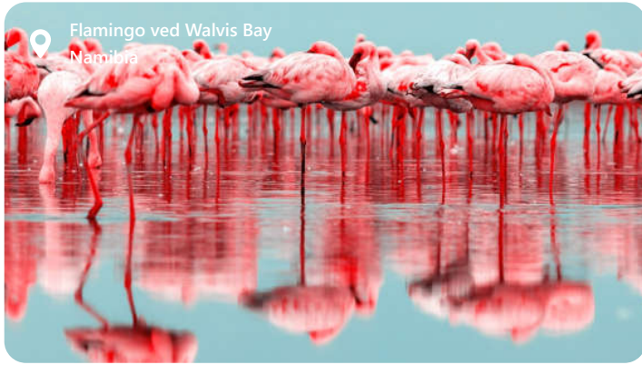
Flamingo ved Walvis Bay Namibia