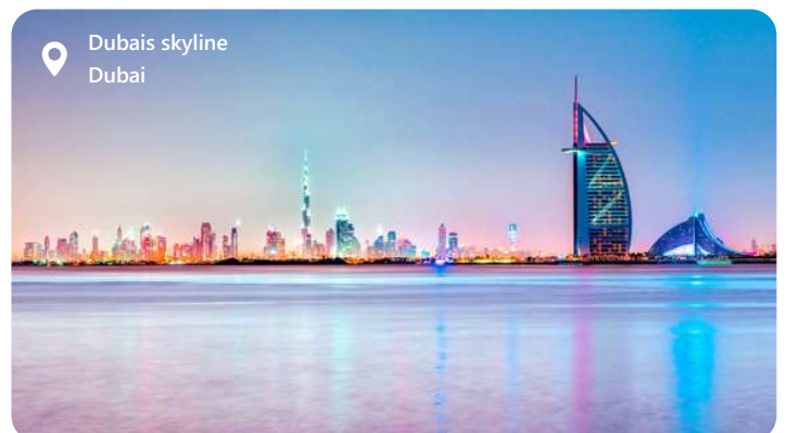
Dubais skyline Dubai

Det anbefales at gå på opdagelse i "Gold Souks" uendelige rækker af butikker der glitre af alle guldbutikkerne.