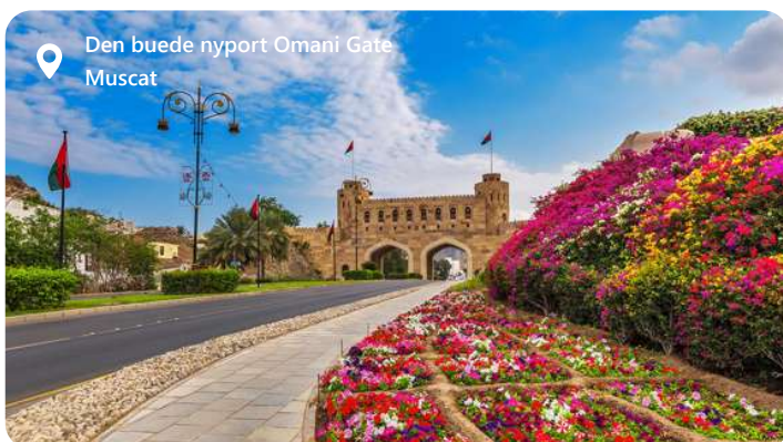
Den buede nyport Omani Gate Muscat