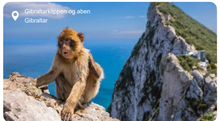
Gibraltarklippen og aben Gibraltar

Gibraltar er et engelsk territorium på Den Iberiske Halvøes sydligste spids. Den ikoniske klippe, The Rock, er selve billedet på Gibraltar, og det er muligt at komme "indenfor" i dens gamle forsvarstunneler. Europas eneste vildtlevende aber møder du også på klippen, og sagnet fortæller, at de er kommet hertil fra Afrika via en underjordisk passage under Gibraltarstrædet, der mandede ud i St. Michaels Grotte, som man længe troede var bundløs. Det er dog ikke tilfældet, og i dag er grotten en stor attraktion, hvor du kan gå rundt mellem de flotte, dramatiske stalagmitter. I den hyggelige by finder du mange butikker og flere charmerende pubber – alt i alt et spøjst lille stykke England blandet med et strejf af Spanien, hvilket giver en helt særlig stemning.