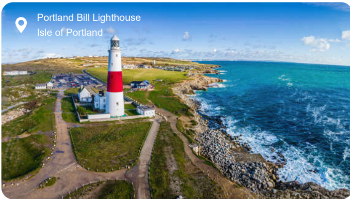
Portland Bill Lighthouse Isle of Portland

Portland rejser sig som en massiv blok af kalksten ud for Dorsets kyst - et rått klippelandskab, der i århundreder leverede den Portland-kalksten, som blev brugt til alt fra St. Paul's Cathedral i London til FN-bygningen i New York. Sporene efter stenbruddene ligger stadig åbne i terrænet, og de snorlige skæringer i klipperne giver øen et særpræget, næsten skulpturelt udtryk. På øens sydspids står det rød-hvide Portland Bill Lighthouse vendt mod et havområde, hvor stærke strømme og revler har sendt mange skibe i vanskeligheder. Længere oppe ligger Portland Castle, der blev opført af Henrik 8. som led i hans forsvar mod de europæiske stormagter - et kompakt, velbevaret fort, der stadig bærer tydelige spor af Tudor-tidens militære arkitektur. Portland er samtidig porten til Jurassic Coast, der er en af Englands mest markante kyststrækninger. Her ligger klinterne i lag som siderne i en geologisk historiebog, og få kilometer mod øst findes både Durdle Door og Lulworth Cove, hvor erosion gennem årtusinder har formet naturens egne vartegn. Og på den smalle landtunge, der forbinder Portland med fastlandet, strækker Chesil Beach sig i næsten 30 kilometer. Rullestenene ligger sorteret i størrelser af naturkræfterne selv - store sten i den ene ende, små i den anden - og det lange, buede strandbånd er et af de mest særprægede steder i hele Sydengland.